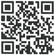
QR Code แผนเสริมสร้างความปลอดภัยฯ

ทั้งนี้ ให้โรงเรียนรายงานเหตุการณ์ความไม่ปลอดภัยแก่นักเรียน ในระบบ MOE Safety Center ด้วย ยกเว้นกรณีการถูกล่วงละเมิดทางเพศ และขอให้ทุกโรงเรียนเข้าร่วมกลุ่มไลน์ ตามกลุ่มไลน์ด้านล่างนี้ เพื่อแลกเปลี่ยนข้อมูลข่าวสาร