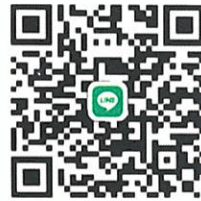
QR Code เข้าร่วมกลุ่มไลน์ MOE SC สพป.ฉช.๒