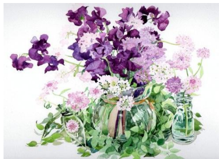
Water Color for Anyone

๒ ในช่วงปิดภาคเรียนที่ ๒ ปีการศึกษา ๒๕๕๕ นี้ (ปลายเดือนเมษายน - ต้นเดือนพฤษภาคม) โครงการพัฒนาห้องสมุดและส่งเสริมนิสัยรักการอ่าน สำนักงานเขตพื้นที่การศึกษาประถมศึกษาเชียงราย เขต ๑ จัดกิจกรรมพัฒนาครูบรรณารักษ์/ครูผู้รับผิดชอบห้องสมุดของโรงเรียนทุกโรงเรียน เพื่อให้ครูที่ทำหน้าที่ดูแลและพัฒนาห้องสมุดโรงเรียนได้มีการพัฒนาร่วมกันผ่านกิจกรรมที่สร้างสรรค์ ดังนั้นคณะครูทุกท่านที่เป็นส่วนหนึ่งของการพัฒนานักอ่าน เตรียมตัวกันด้วยนะคะ หากจะดำเนินกิจกรรมในวันใดจะแจ้งให้ทราบอีกครั้งหนึ่งผ่านทางหนังสือราชการและเว็บไซต์ของสำนักงานเขตพื้นที่การศึกษาประถมศึกษาเชียงราย เขต ๑ แล้วพบกันนะคะ